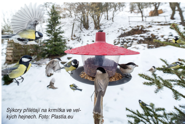
Sýkory přilétají na krmítka ve velkých hejnech.

Hlavním cílem programu Ptačí hodinka je zapojit veřejnost do zimního přikrmování ptáků a prostřednictvím sčítání zjistit více o chování ptáků přezimujících v České republice. „Ukážeme účastníkům, že přispět k vědeckému poznání může každý. A ještě ho to bude bavit. Díky našim podkladům si i školní děti snadno zvlád-