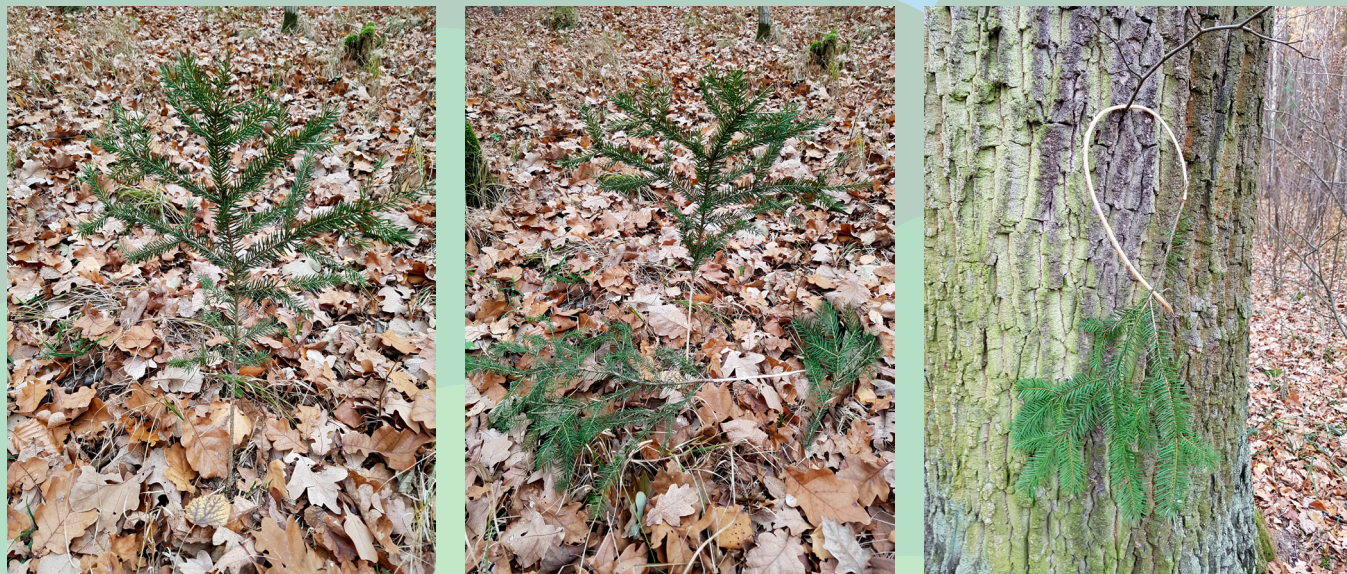
1 - Nástřelový zálomek, označuje místo, kde stála zvěř v okamžiku zasažení střílou, tedy místo nástřelu. 2 - Stopový zálomek, ukazuje směr odskoku zvěře, v tomto případě "aň odskokla dolva". 3 - Vystřažený zálomek, upozorňuje na zařízení, nebezpečí nebo místo, kam chceme zakázat vstup.

Popište, co nám říkají záločky na připojených snímcích?